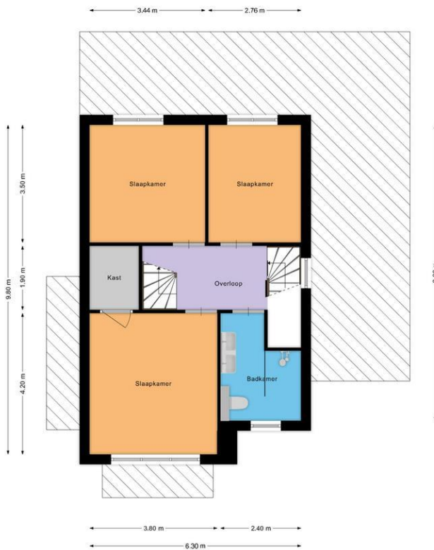
Hoefblad 2 Vroomshoop

De plattegronden zijn geproduceerd voor promotionele doeleinden en ter indicatie. Aan de plattegronden kunnen geen rechten worden ontleend © moefoto.nl