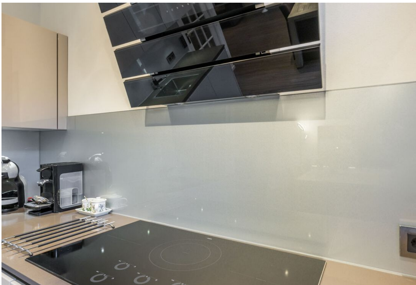
Koestraat 37, Vught