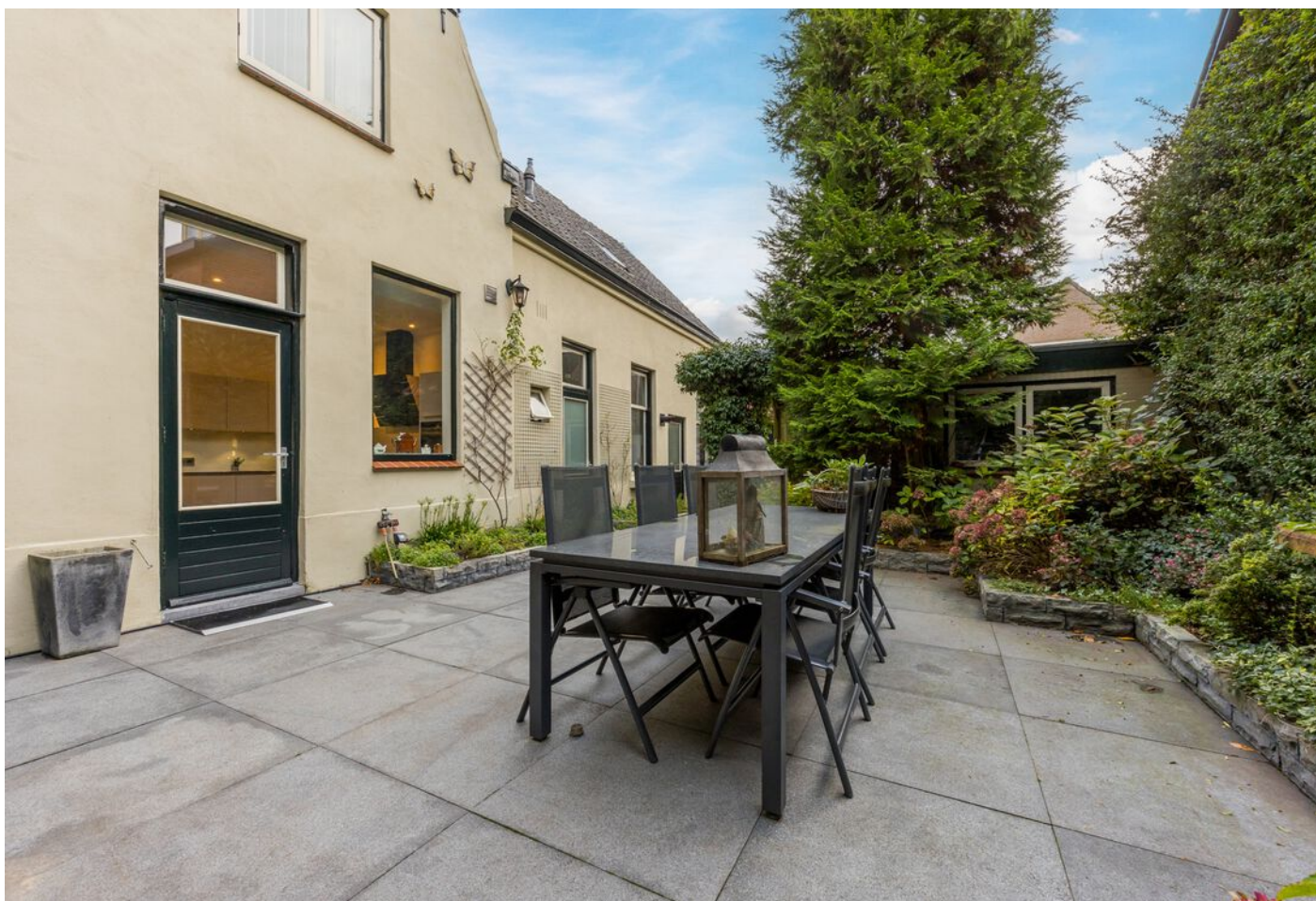
Koestraat 37, Vught