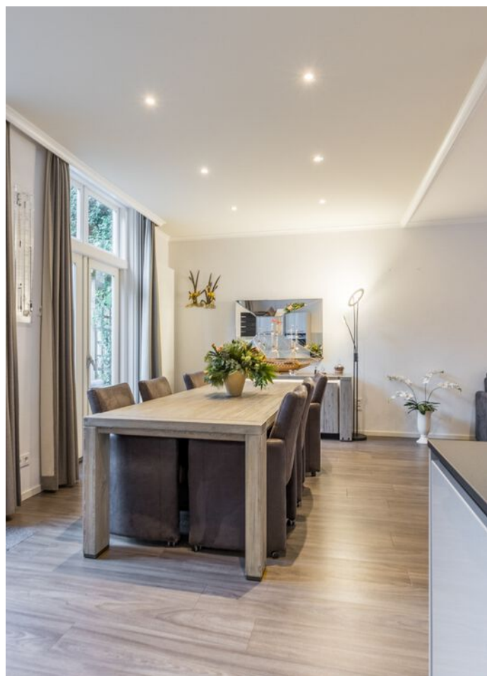
Koestraat 37, Vught