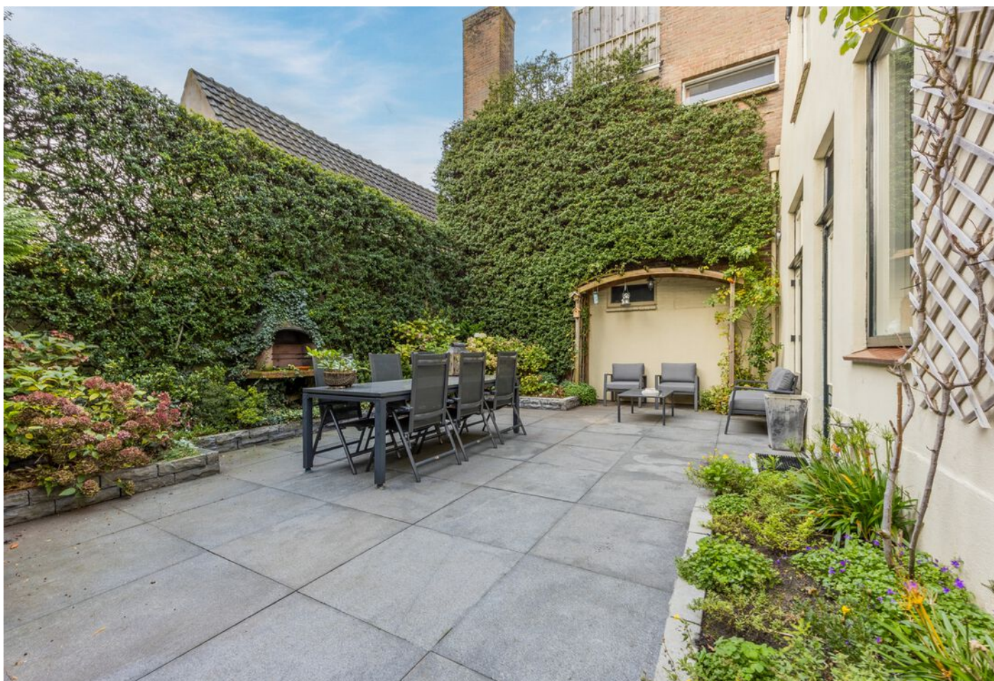
Koestraat 37, Vught