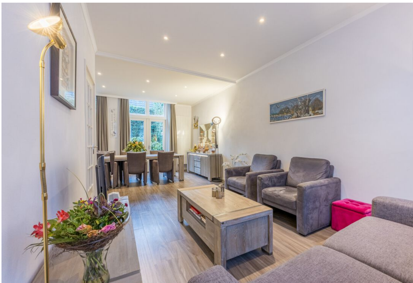
Koestraat 37, Vught