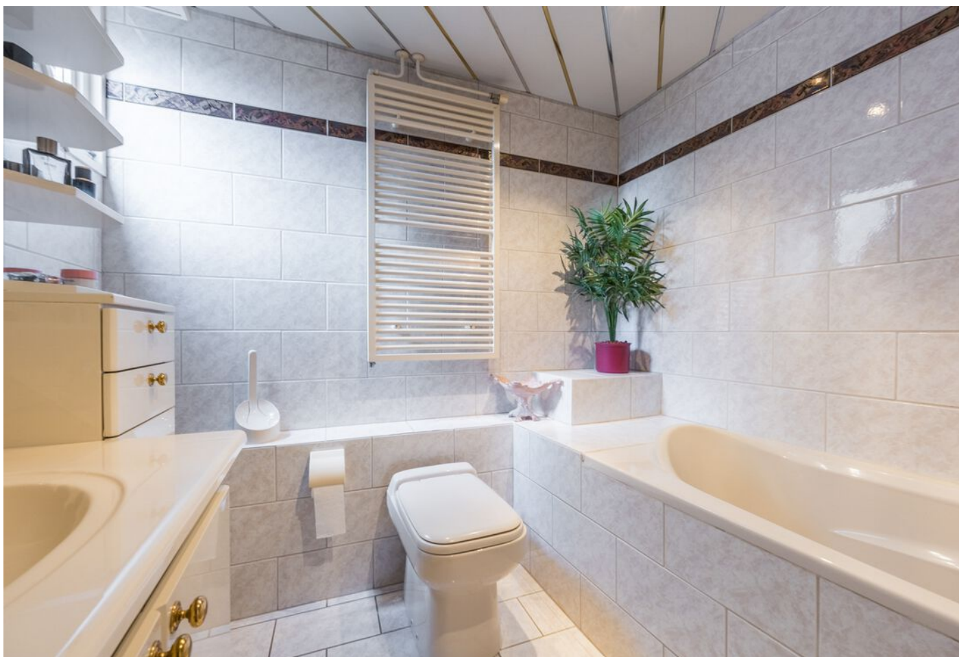
Koestraat 37, Vught