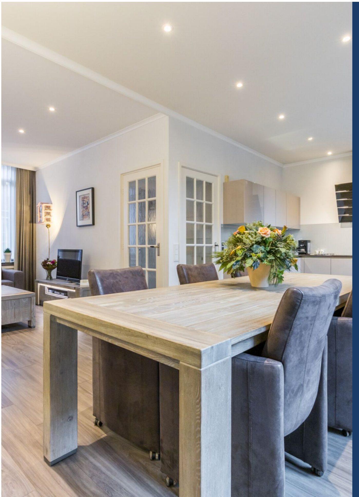
Koestraat 37, Vught