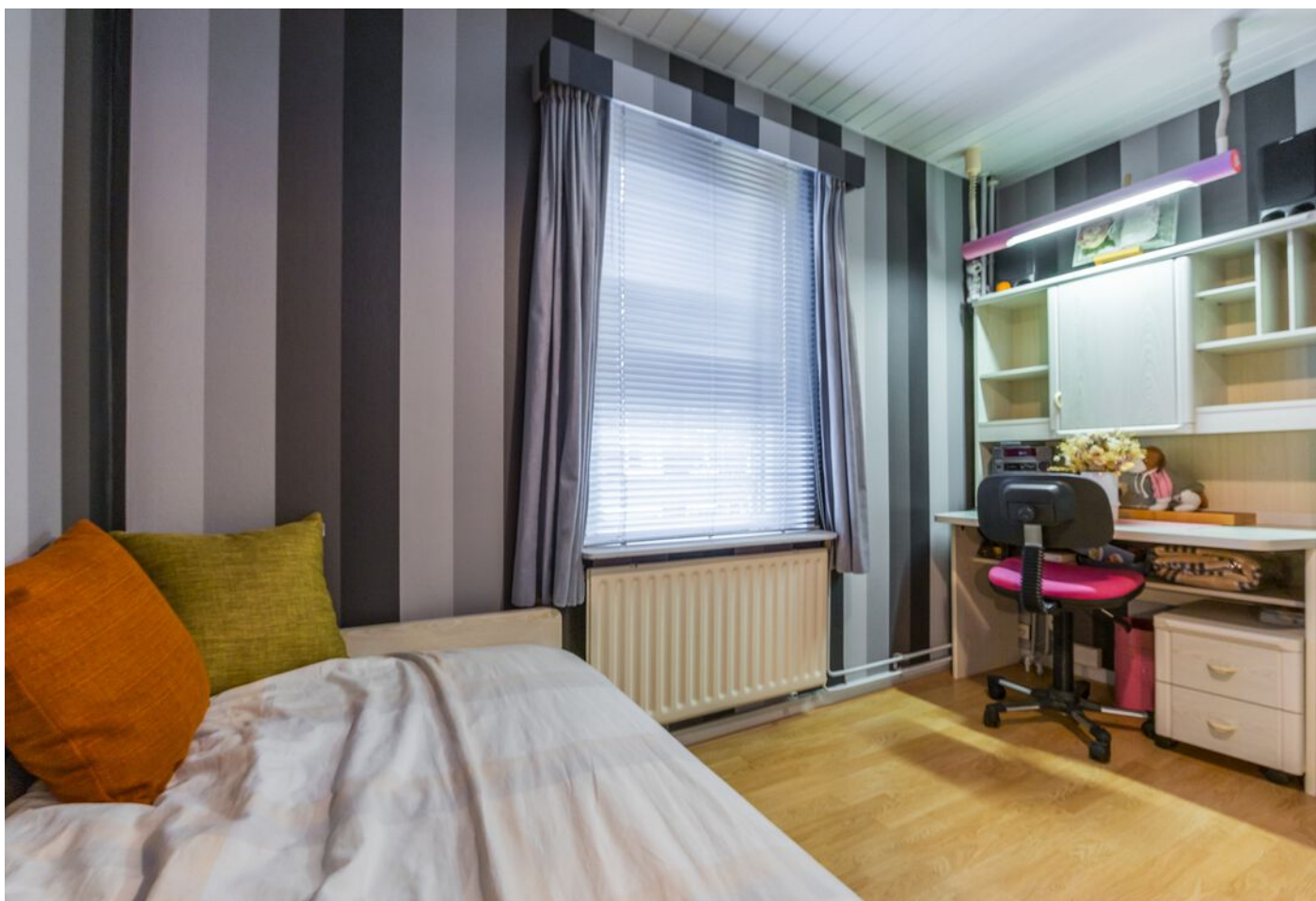
Koestraat 37, Vught