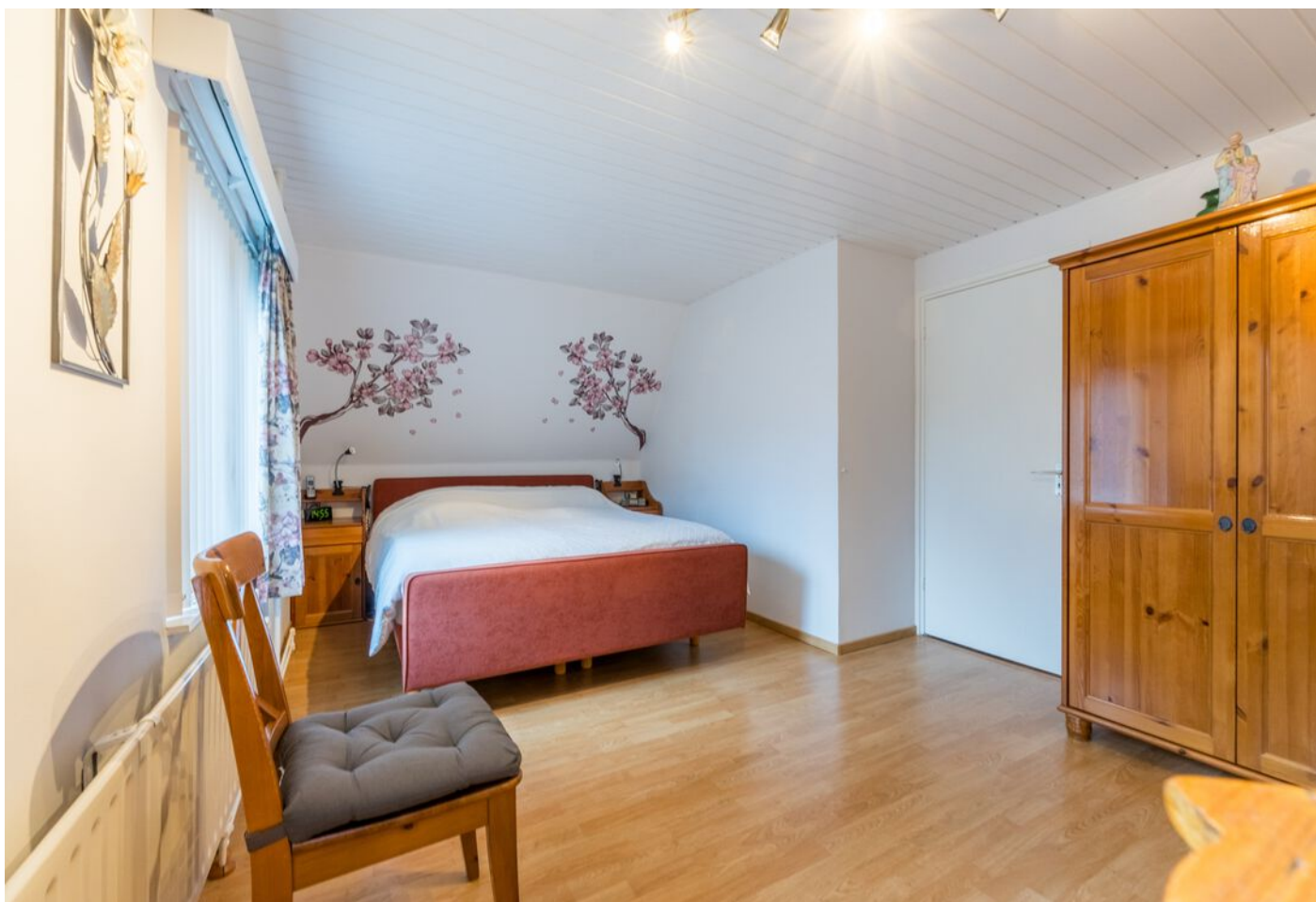
Koestraat 37, Vught