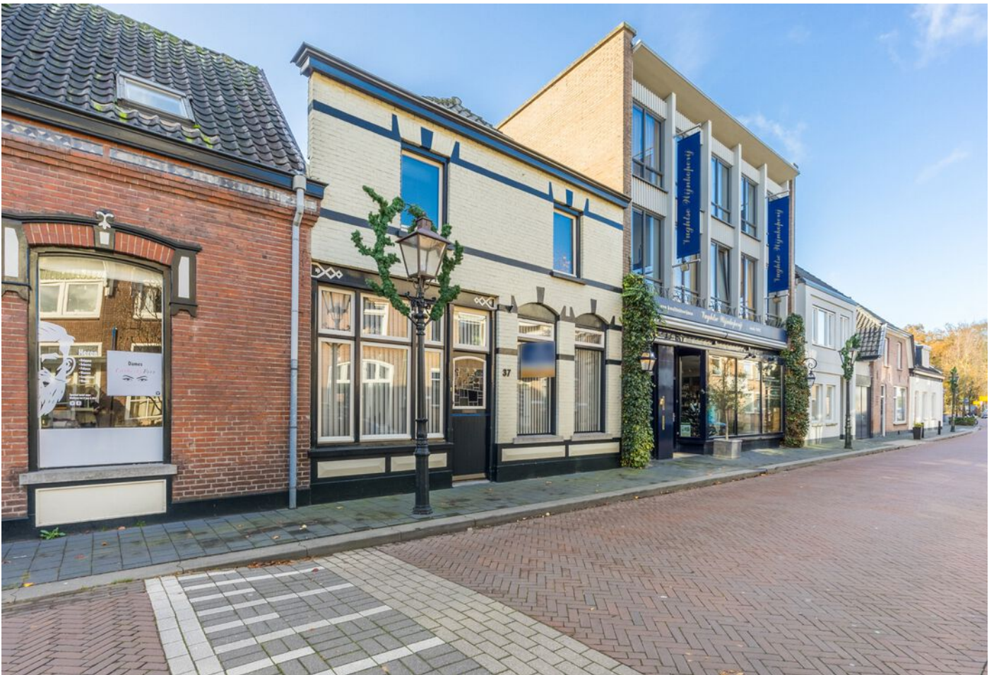
Koestraat 37, Vught