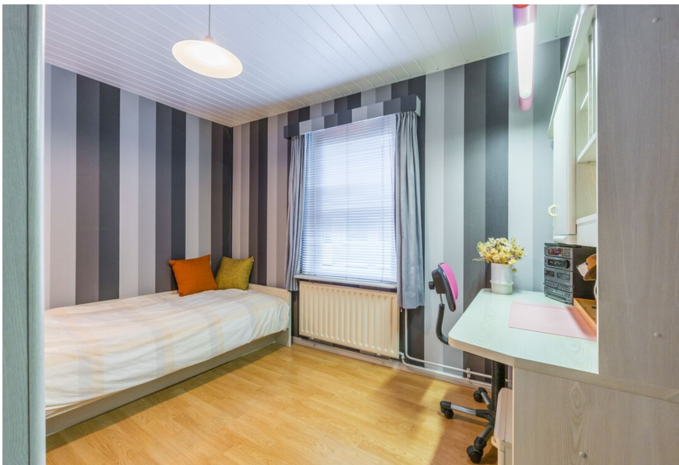
Koestraat 37, Vught