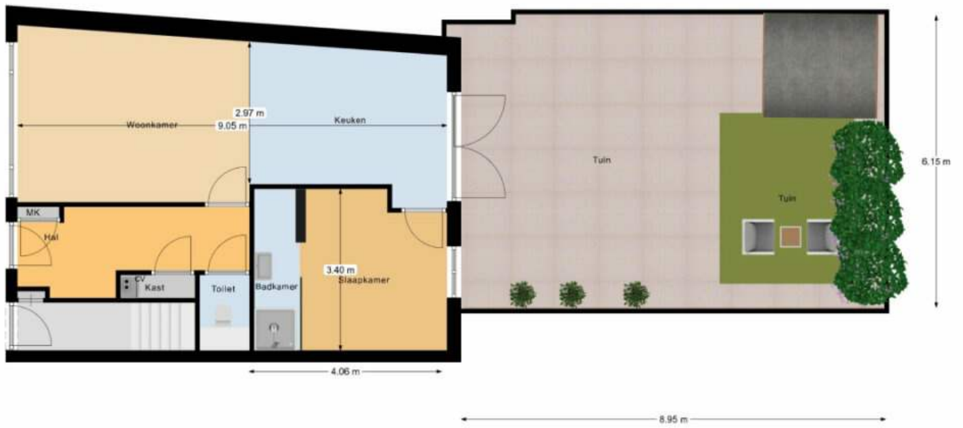
Begane Grond Tuin