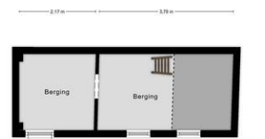
Aan de plattegronden kunnen geen rechten worden ontleend © Zibber www.zibber.nl