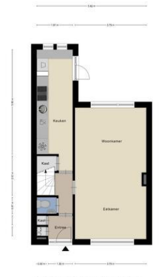
Aan de plattegronden kunnen geen rechten worden ontleend © Zibber www.zibber.nl